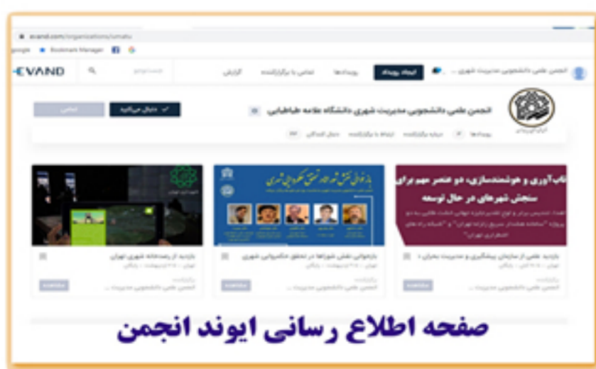
صفحه اطلاع رسانی ایوند انجمن

یکی از ابزارهای مدرن اطلاع رسانی برنامه ها در حال حاضر سایت ایوند می باشد. با کمک این سایت میتوان برنامه ها را تبلیغ و ثبت نام افراد مختلف را به صورت دسته بندی شده در آن انجام داد. با توجه به تعداد زیاد برنامه های انجمن و لزوم اطلاع رسانی دقیق و به موقع و دانستن تعداد دقیق ثبت نام ها انجمن از این ابزار مفید و رایگان جهت اطلاع رسانی برنامه های خود استفاده نموده است.